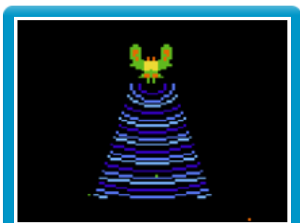
Rayo de tracción

Cada enemigo jefe puede usar un rayo de tracción para robarte la nave. Si consigue atraerte hacia él, perderás una nave. Si lo derribas, recuperarás la nave capturada que se unirá a la actual para formar la nave doble. Con esto, multiplicarás por dos tu potencia de fuego. Tendrás que alcanzar dos veces a cada enemigo jefe para derribarlo.